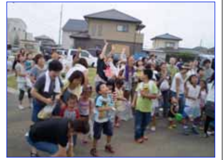
前回の様子 写ってるかな？